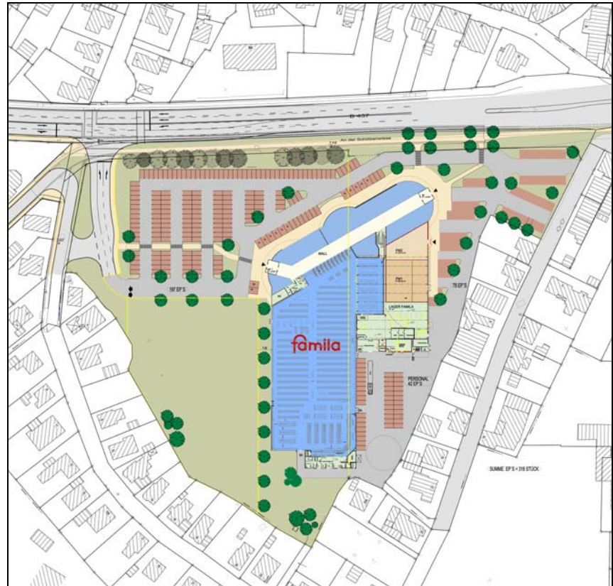
Abb.: Lageplan der Familia-Erweiterung.

Auf eine detaillierte Darstellung der einzelnen Sortiment wird an dieser Stelle verzichtet und auf den Punkt - Festsetzungen des Bebauungsplanes - verwiesen. Die nachfolgende Abbildung verdeutlicht die geplanten Flächennutzungen des Verbrauchermarktes.