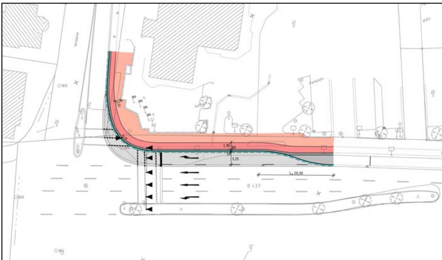
Geplante Rechtsabbiegespur an der Rathauskreuzung

Nachfolgend verdeutlichen zwei Abbildungen den aktuellen Planungsstand der Straßenverkehrsplanung, die parallel zur Bauleitplanung durchgeführt und genehmigt wird.