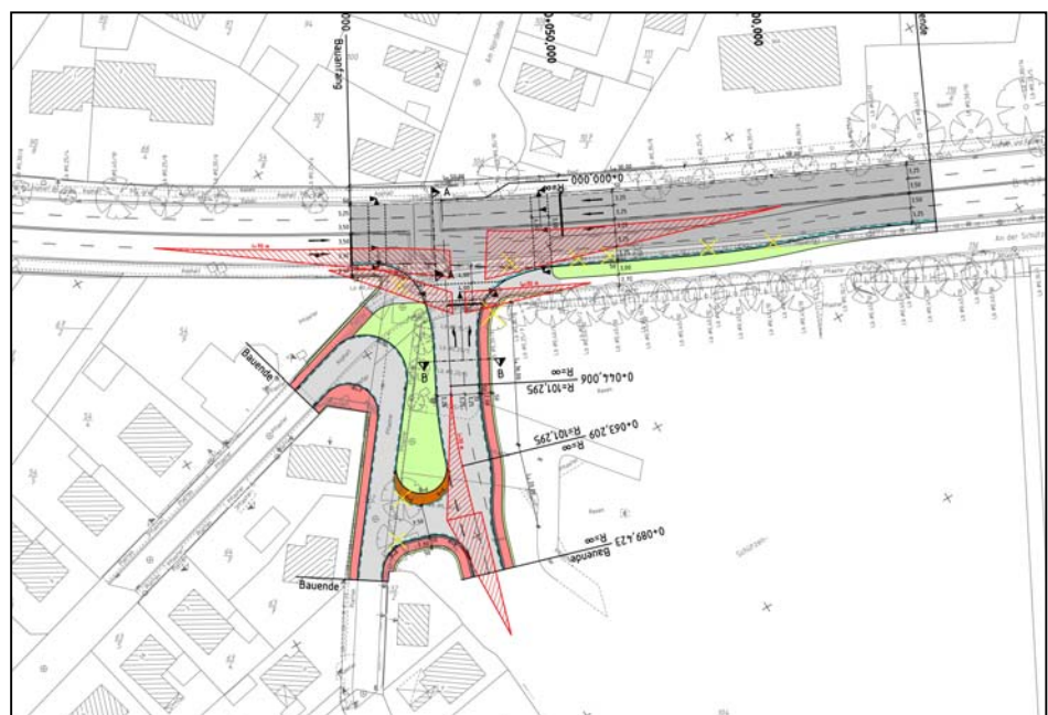
Geplanter neuer Knotenpunkt